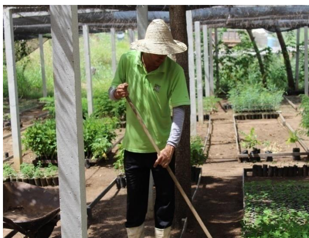
Manutenção dos canteiros no Viveiro de Mudas "O Caatingueiro"