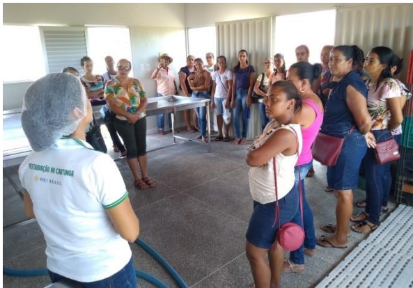
Intercâmbio sobre Beneficiamento, Produção e Comercialização Certificada de Frutos da Caatinga – Cooperativa Ser do Sertão/ Pintadas/BA.