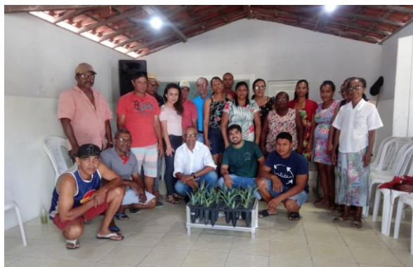
Oficina sobre Produção de Mudas de Sisal e Técnicas de Manejo da Cultura – Lagoa da Pedra/Valente/BA