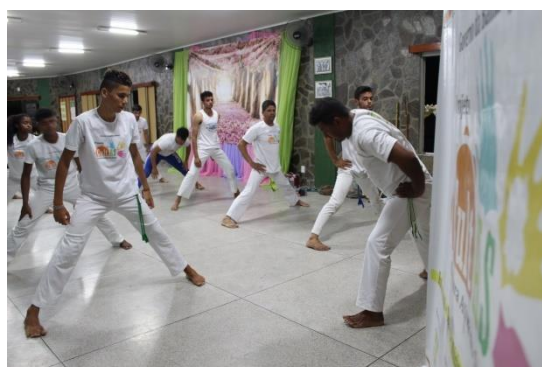
Oficina de Capoeira do Projeto CultAS