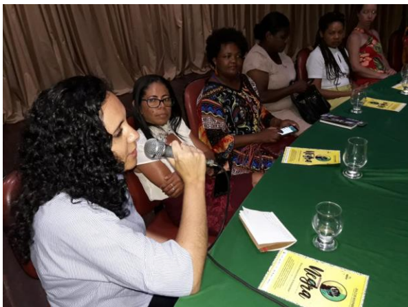
Mesa de Diálogo sobre Cultura Ancestral e Empreendedorismo da Mulher no Território do Sisal, na Semana Negra de Conceição do Coité/BA.