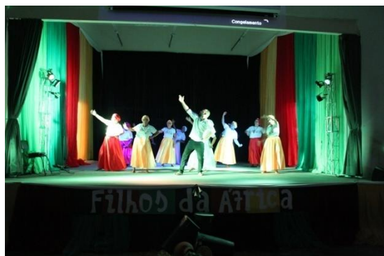
Festival de Cultura do Projeto Cultas – Tema: Filhos da África – “Eu Sou porque nós somos” – Casa da Cultura de Valente