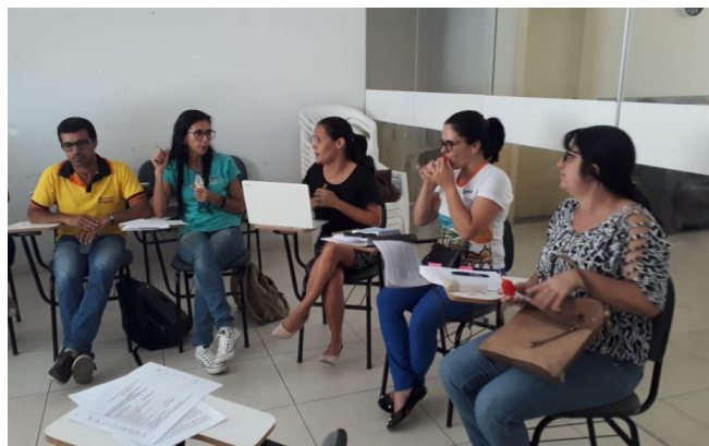
Reunião do Comitê Gestor da Base Nacional Comum Curricular de Valente.