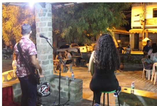
Show de Música e Poesia – Casa da Cultura de Valente