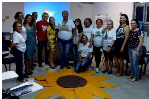
Reunião do Fórum EJA Sisal.