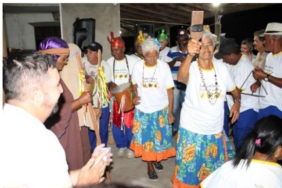
Folia de Reis – Comunidade de Barriguda/Valente/BA