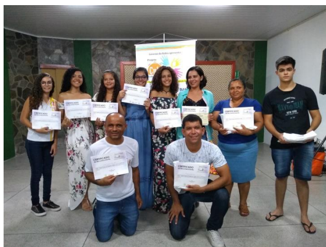
Classificados no Concurso de Poesia sobre a Caatinga