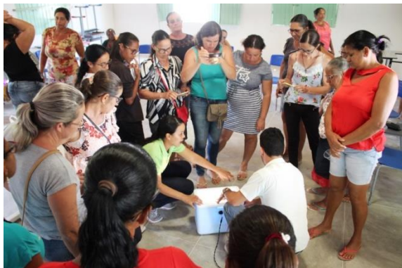
Oficina sobre Avicultura com confecção de chocadeira e ovoscópio artesanal – EFA Valente