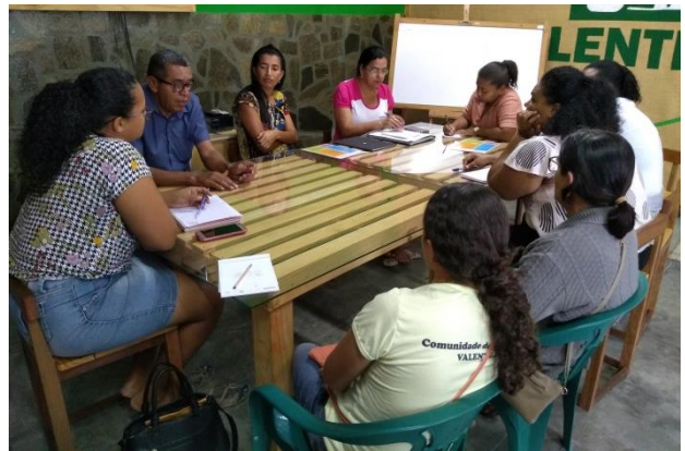
Reunião de Planejamento da Rede Ponto Nosso.