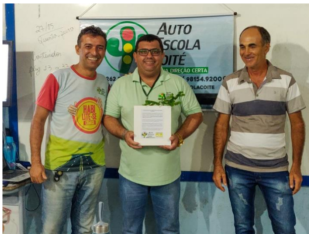
Distribuição de mudas através de parceria com o Projeto Compensa da Autoescola Coité