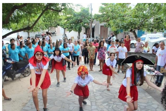
Apresentação do Teatro de Rua do Projeto CultAS na Conferência Territorial dos Direitos da Criança e do Adolescente