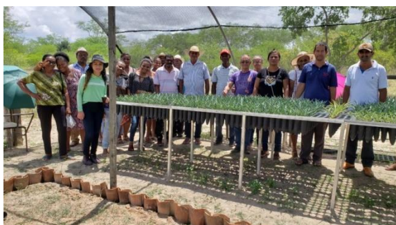
Intercâmbio sobre Pedagogia da Alternância e Agricultura Familiar no fortalecimento das cadeias produtivas do semiárido – EFA Valente