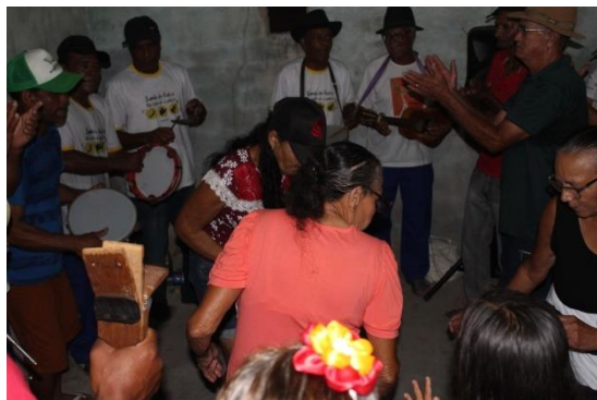
Samba de Roda – Comunidade de Vargem Grande/Valente/BA