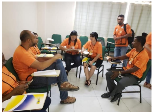
Participação no Congresso da UNISOL Bahia.