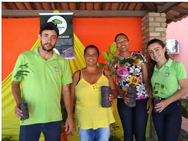
Distribuição de mudas no Dia da Árvore