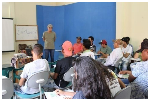
Curso de Produção de Mudas oferecido pela EMBRAPA e UFRB para equipe de colaboradores da Fundação APAEB e alunos da EFA Valente.