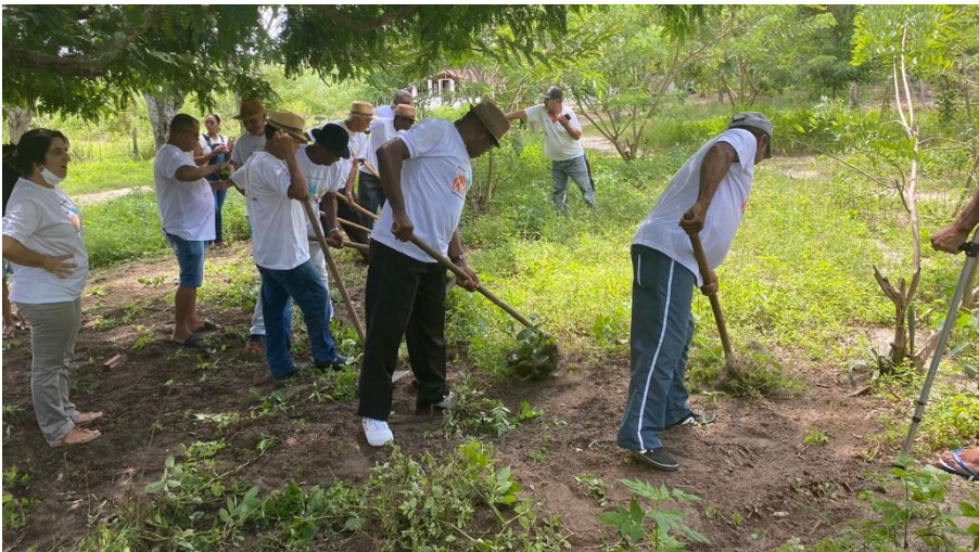
Boi Roubado – EFA Valente - Projeto CultAS