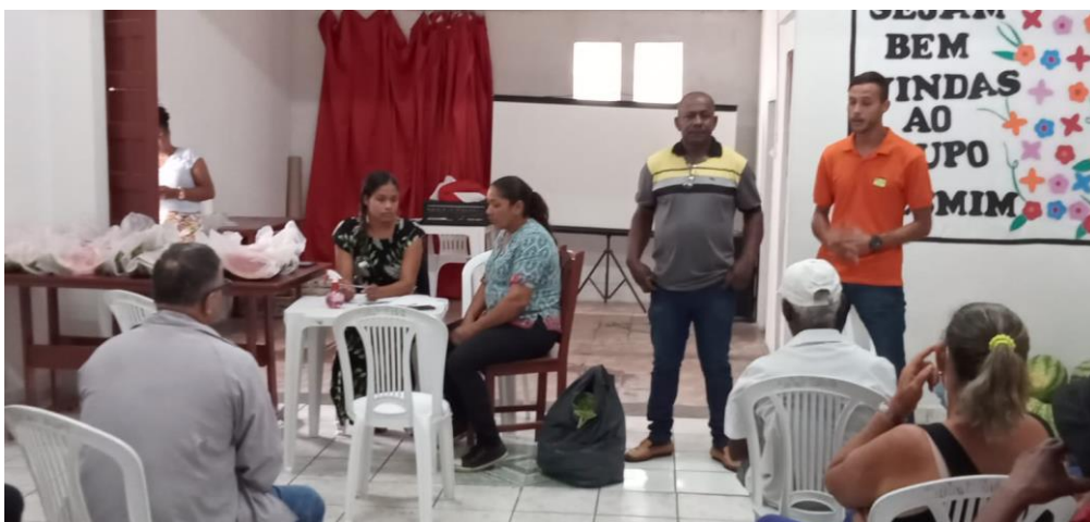
Fala sobre a importância do Programa de Aquisição de Alimentos