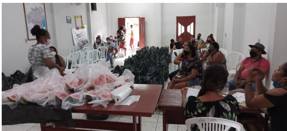
Bate-papo com as famílias beneficiárias