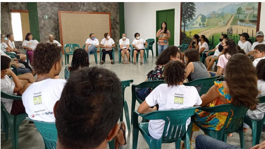
Encontro de Avaliação do Projeto CultAS