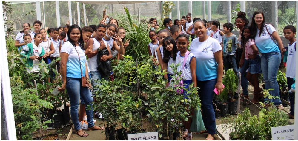
Visitas de Escolas no Dia da Árvore