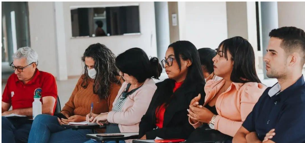
Encontro da Articulação do Campo sobre Democracia e Eleições