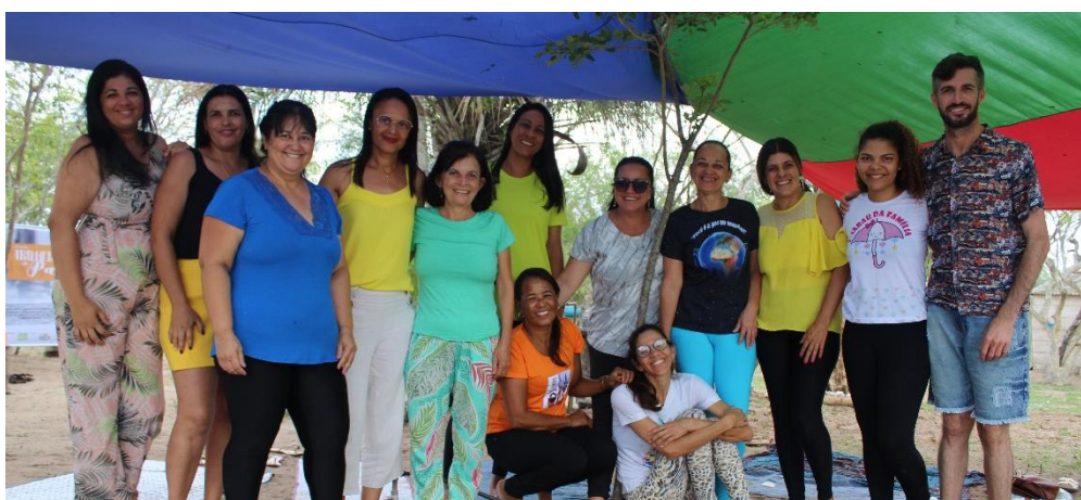
Vivência com educadores/as e agentes do sistema de garantia de direitos no Sítio Alecrim