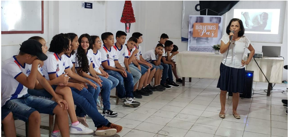
Encontro com crianças e adolescentes nas escolas