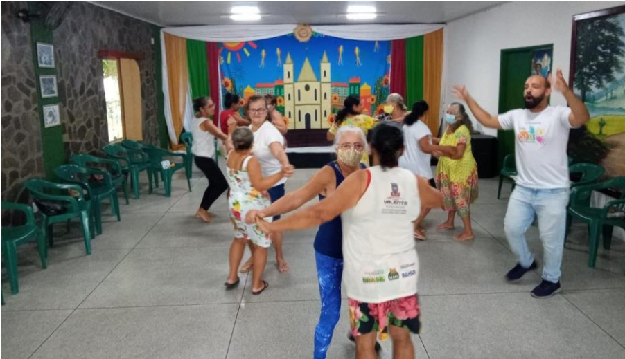
Oficina de Dança – Projeto CultAS