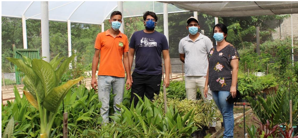
Visita da CAR ao Viveiro