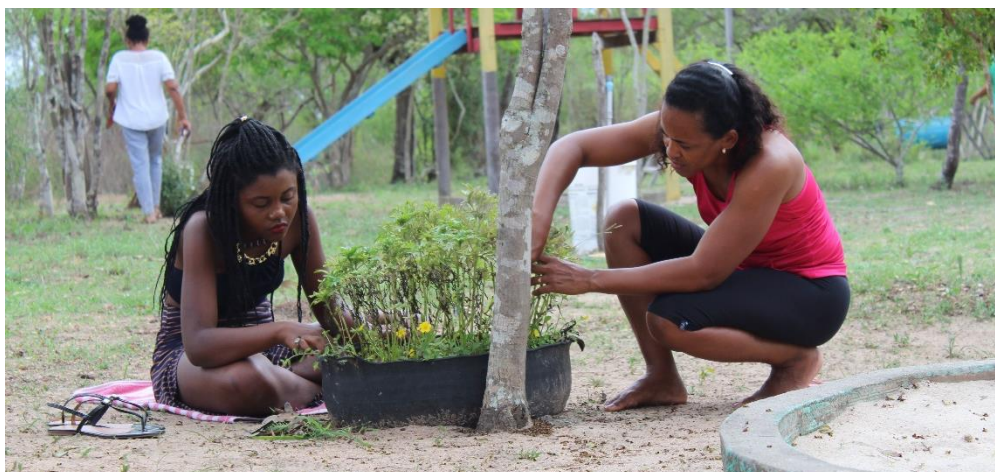
Vivência com educadores/as e agentes do sistema de garantia de direitos no Sítio Alecrim