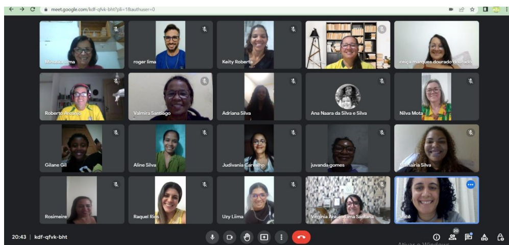
Devolutiva para apresentação do Guia