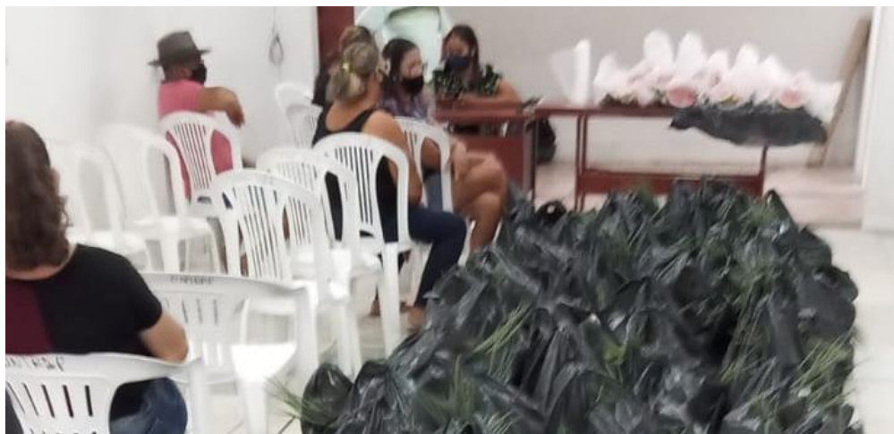
Cestas montadas para distribuição