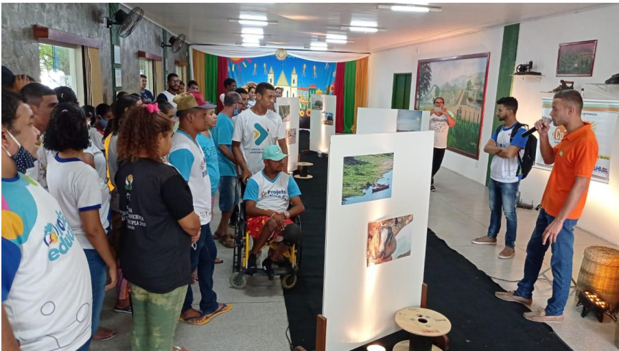
Mostra Fotográfica– Projeto CultAS