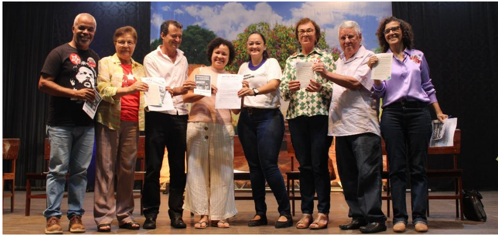
Entrega de carta-compromisso aos candidatos e candidatas