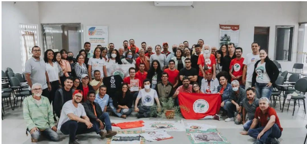
Encontro da Articulação do Campo sobre Democracia e Eleições