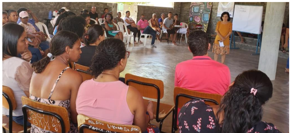
Encontro com famílias