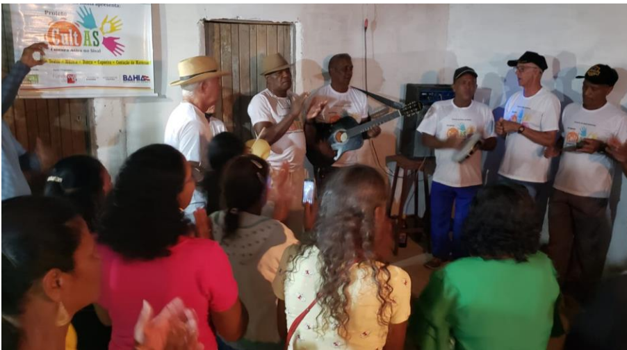
Festival Comunitário de Cultura Popular - Projeto CultAS