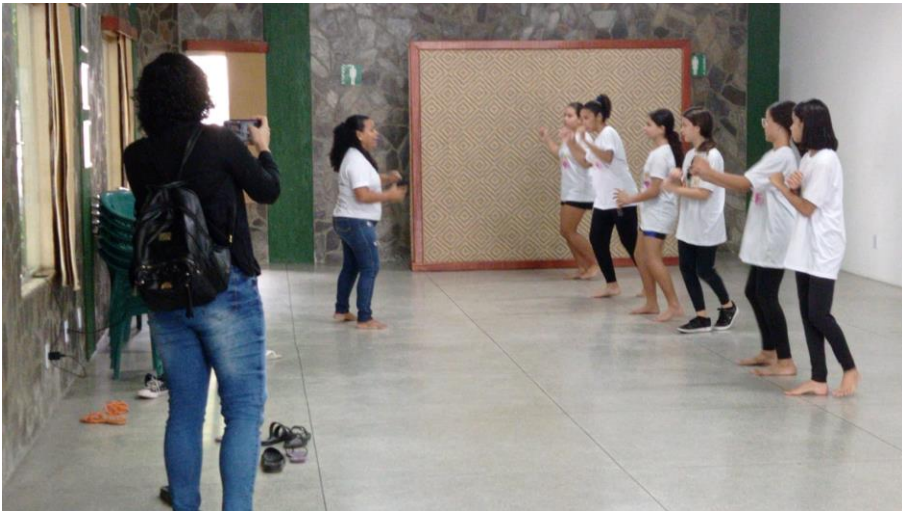
Oficina de Teatro – Projeto CultAS