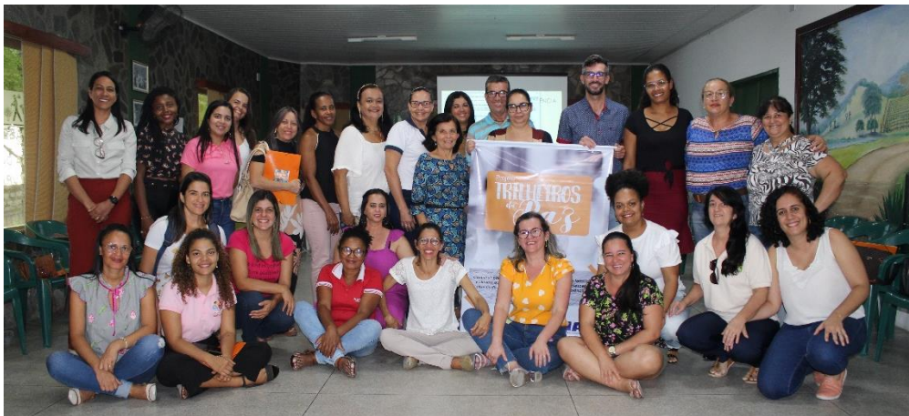
Encontro com educadores/as e agentes do sistema de garantia de direitos